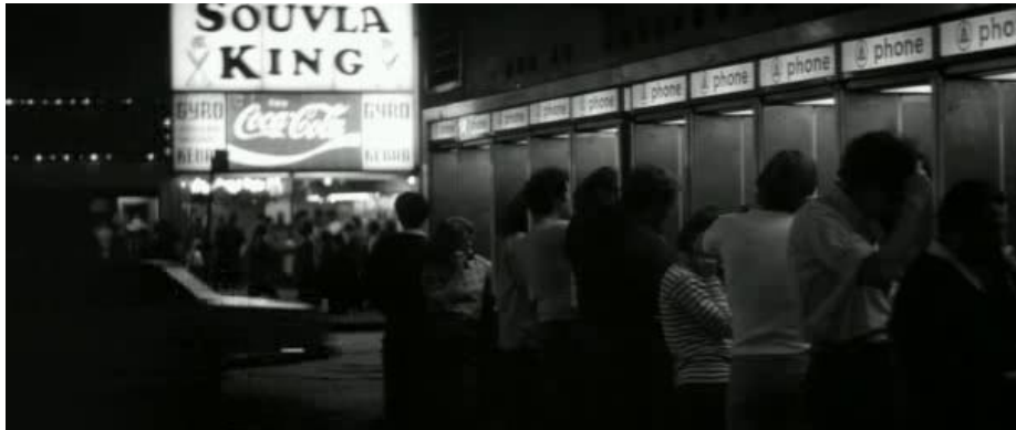
Figura 10. Fotograma. Transeúntes en Manhattan.