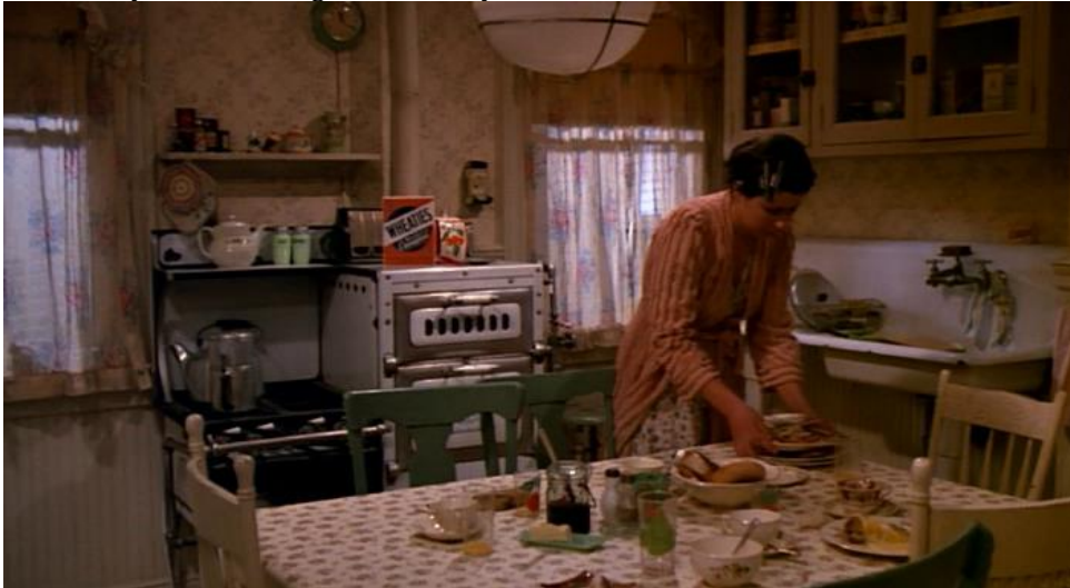
Figura 3. Fotograma. Desayuno en un hogar de Brooklyn.