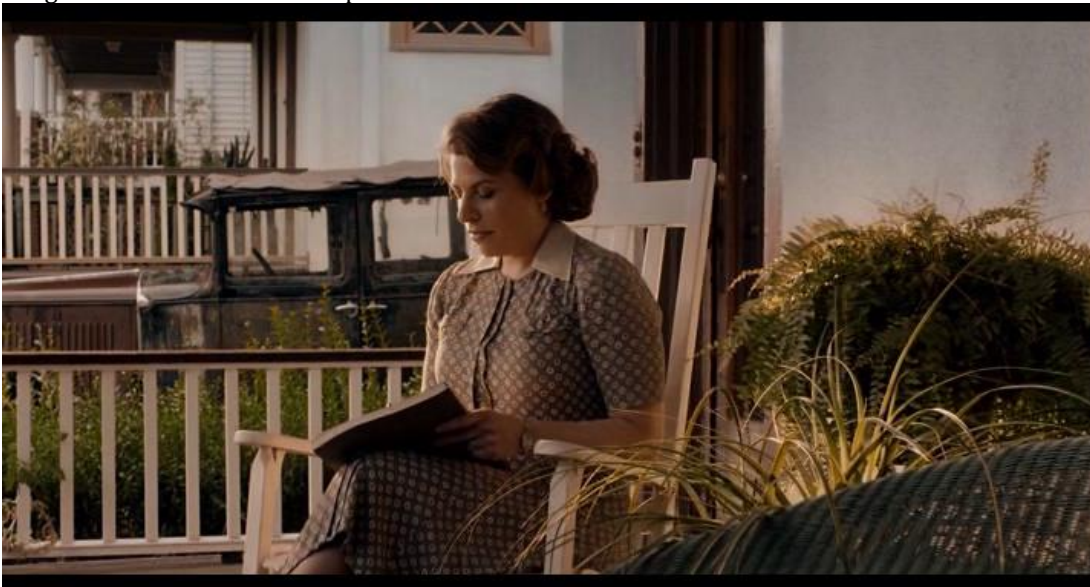
Figura 6. Fotograma. Viviendas de concepción horizontal del Bronx.