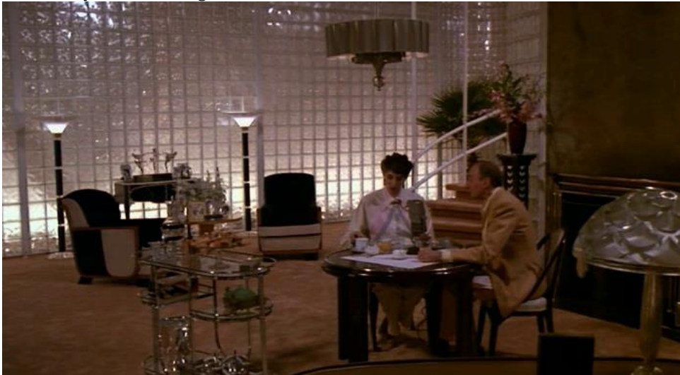
Figura 4. Fotograma. Desayuno en un hogar de Manhattan.