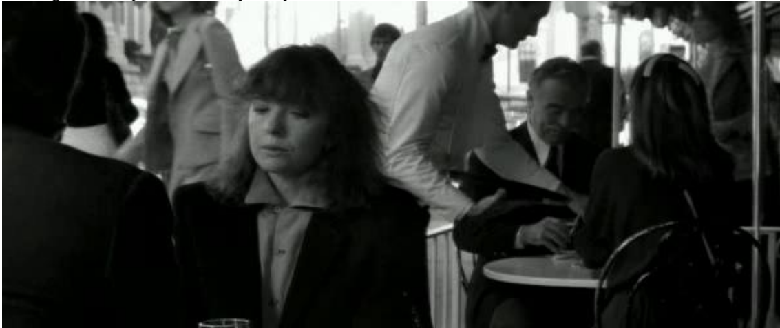
Figura 11. Fotograma. Ruptura de Yale y Mary en una terraza de Manhattan.