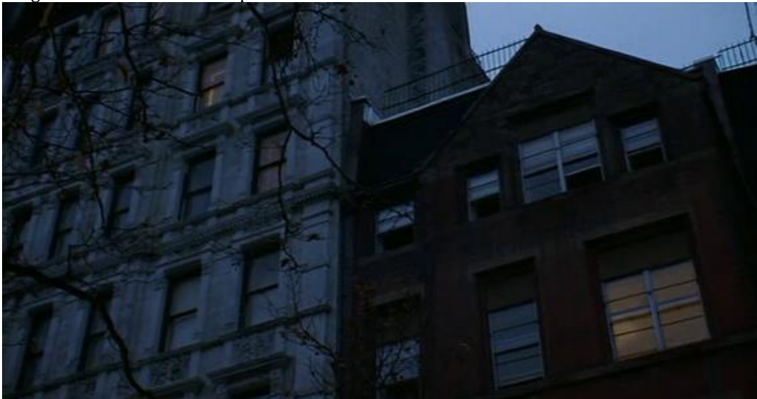
Figura 5. Fotograma. Viviendas de concepción vertical de Manhattan.