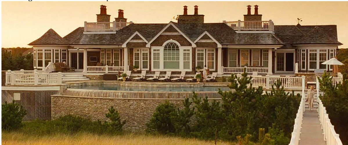
Figura 2. Fotograma. Casa de los Hamptons.