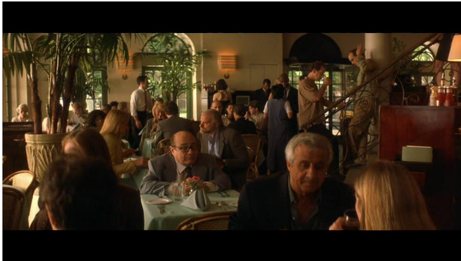
Figura 8. Fotograma. Restaurantes en Manhattan.

Fuente: Todo lo demás , 2003, minuto 0:54:13.