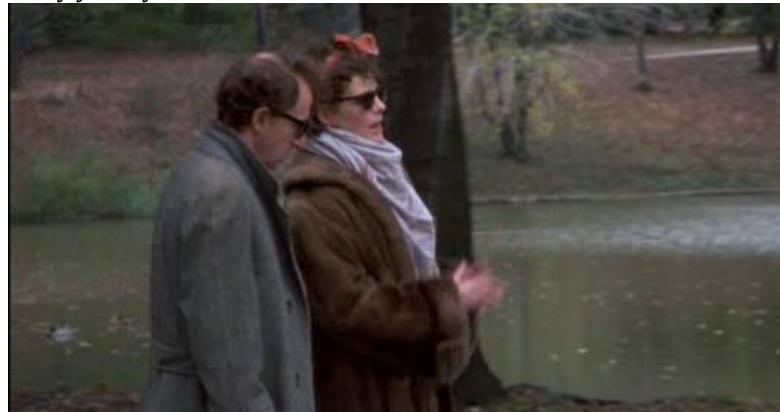
Figura 14. Fotograma. Mickey y Holly en Central Park.