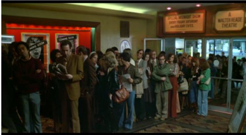
Figura 7. Fotograma. Colas de cine en Manhattan.